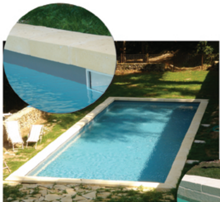
Margelle bassin double