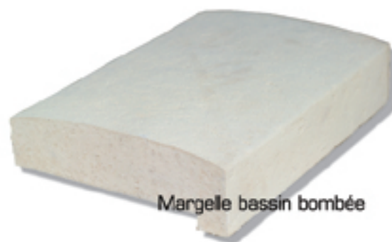
Margelle bassin bombée